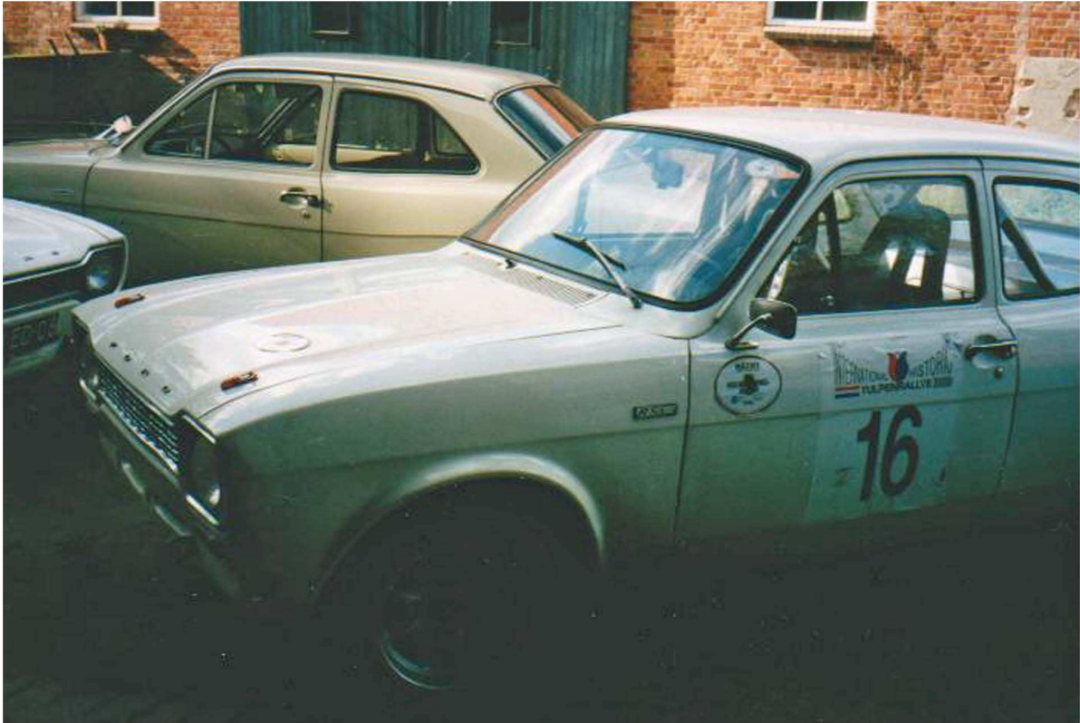
Ford Escort MK1 RS 2000 Bj. 1973