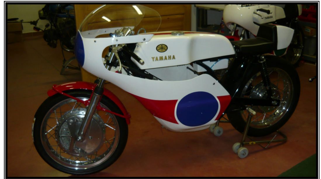
Yamaha R5 vom Lucas-Racing-Team